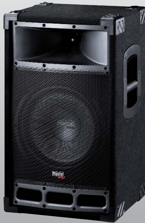
Magnat Pro PA 112